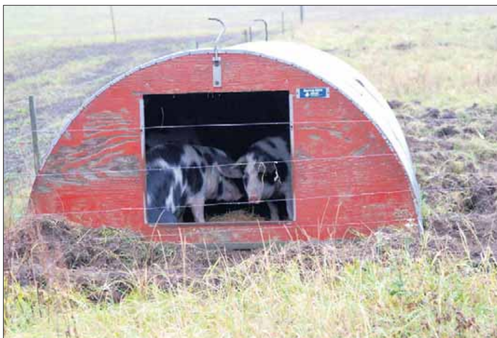
Er landbruget enten industri eller klappedyr?

oritering af anvendelsesmuligheder og begrænsninger i det åbne land. Men på hvilken